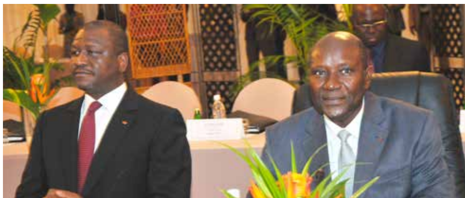
L'Atelier Gouvernemental organisé le 16 juillet 2015 à Abidjan a consacré l'adoption d'une Charte pour l'amélioration de l'environnement des affaires en Côte d'Ivoire.

A u cours des travaux, les membres du Gouvernement ivoirien, à leur tête, le Premier Ministre, SEM Daniel Kablan Duncan ont partagé l'expérience de Singapour et de Géorgie en matière d'amélioration du cadre des affaires. En effet, ces deux pays font partie des meilleures économies au classement Doing Business du Groupe de la Banque Mondiale en occupant respectivement la 1 ère et la 15 è place au niveau mondial.